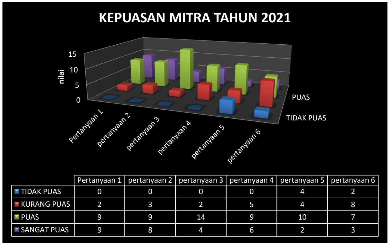
Gambar 1. Grafik Kepuasan Mitra Kerjasama

Secara visual, deskripsi terhadap mitra kerjasama dapat dilihat seperti pada grafik di bawah ini.